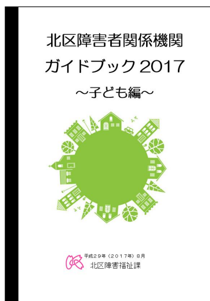
クリーム色の表紙です