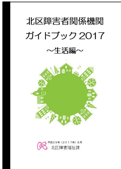
ピンク色の表紙です